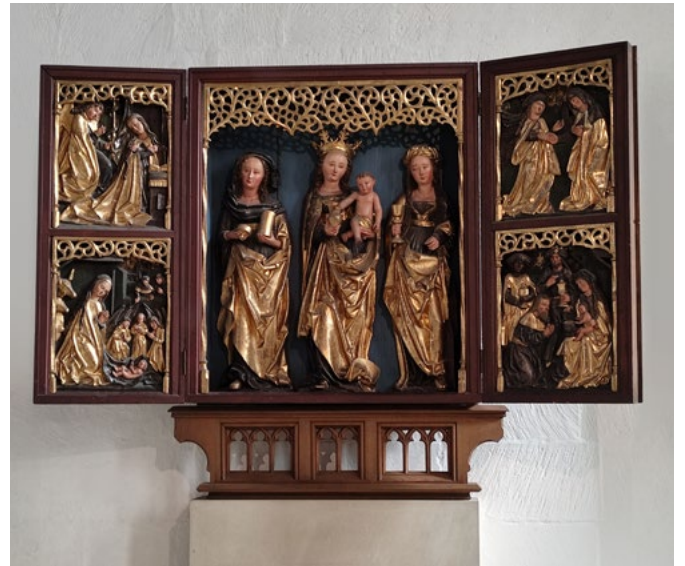
Oben: Marienaltar Tryptichon, Lambertikirche Münster (Westf.)