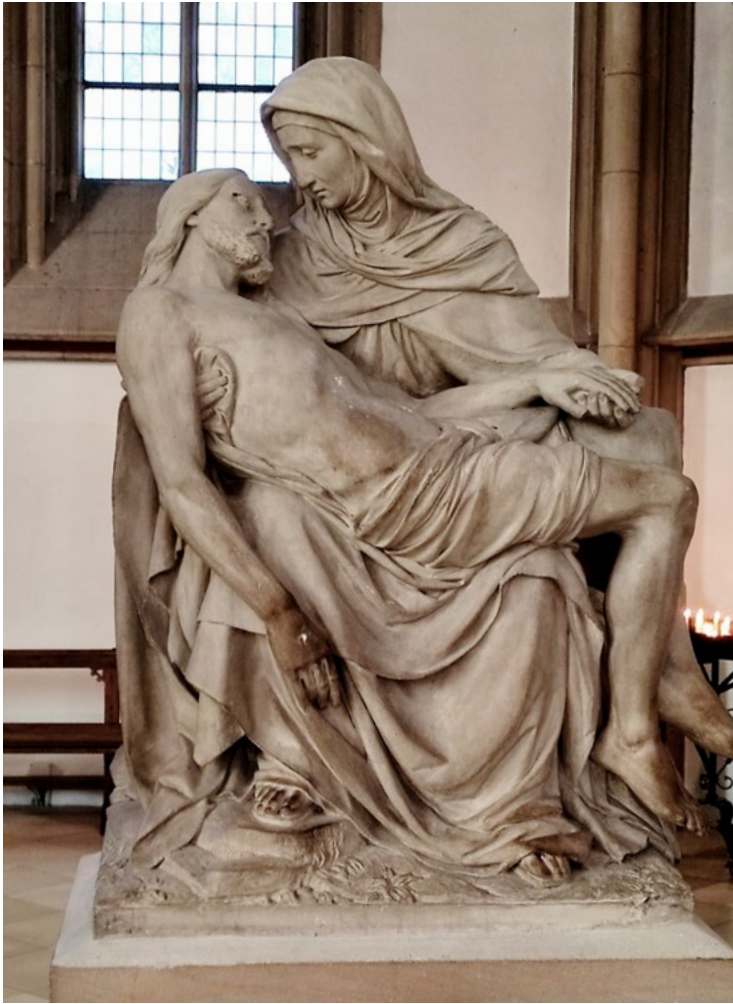
Pietà (Maria mit dem Leichnam Jesu im Arm), Lambertikirche Münster (Westf.)