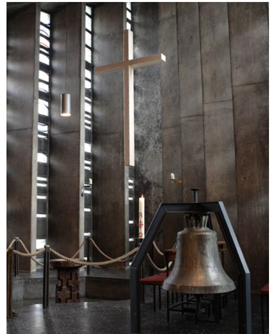
Links: Blick vom Baptisterium auf den Hauptaltar (großer Gottesdienstraum) Rechts: Kreuz und Glocke aus der ehemaligen Lukaskirche Linke Seite: Pius-Lukas-Kirche (Außenansicht)