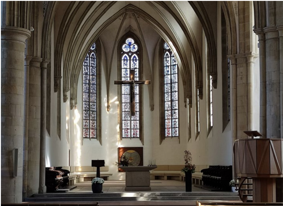
Links: Kreuz, Kanzel, Ambo und Altartisch, Evangelische Apostelkirche, Münster (Westf.)