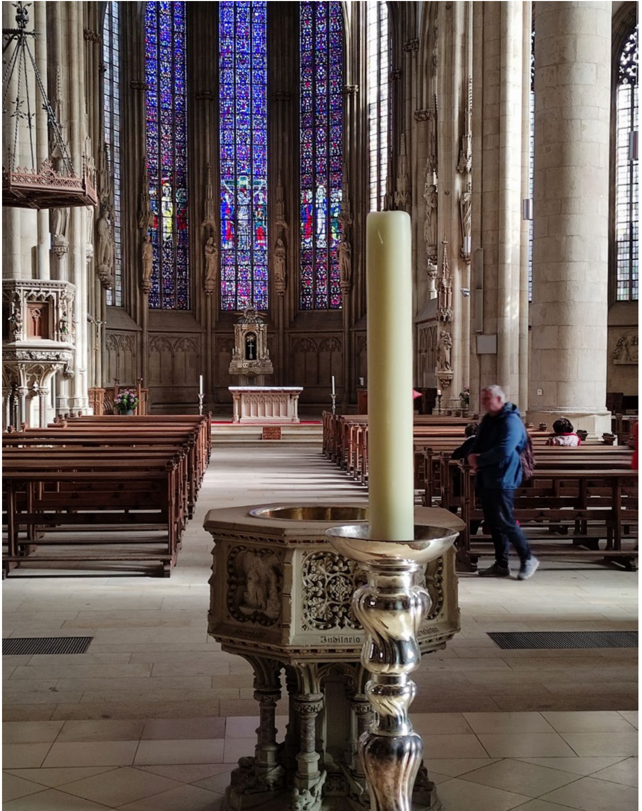
Blick in die Lambertikirche Münster (Westf.) mit Taufbecken, Kanzel, Ambo, Altartisch und Kreuz