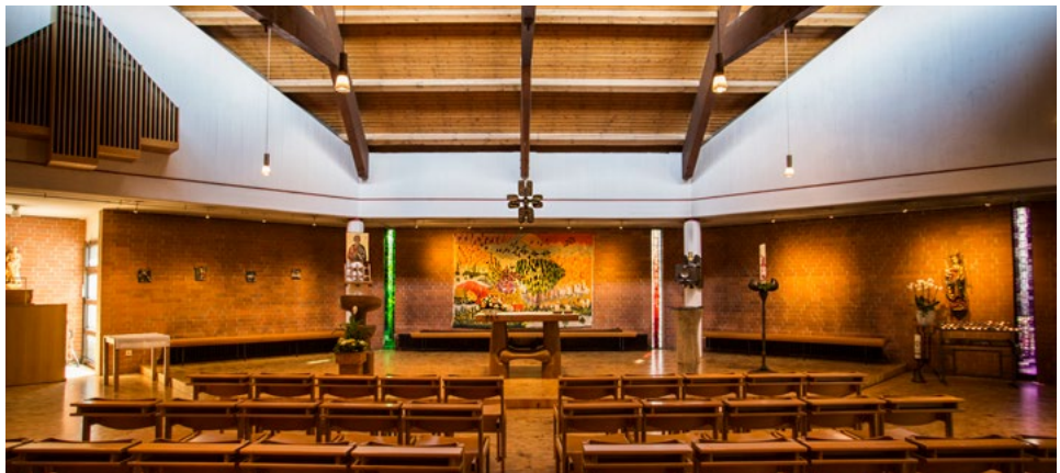
Blick in den katholischen Kirchraum des ökumenischen Zentrums

In diesem Kirchenzentrum sollte es einen gemeinsam genutzten Gottesdienstraum geben. Doch sowohl Präses Hans Thimme wie auch Erzbischof Lorenz Jaeger bestanden darauf, dass es im gemeinsamen Kirchenzentrum zwei getrennte Kirchenräume gibt. Ende 1970 stimmten schließlich beide Kirchenleitungen „dem (letztlich realisierten) Vorhaben zu, in dem neu zu errichtenden Kirchenzentrum eigenständige Gottesdiensträume in getrennter Trägerschaft vorzusehen – die evangelische Jakobus-Kirche und die katholische St. Andreas-Kirche unter dem einen Dach des neuen gemeinsamen Zentrums.“ 23