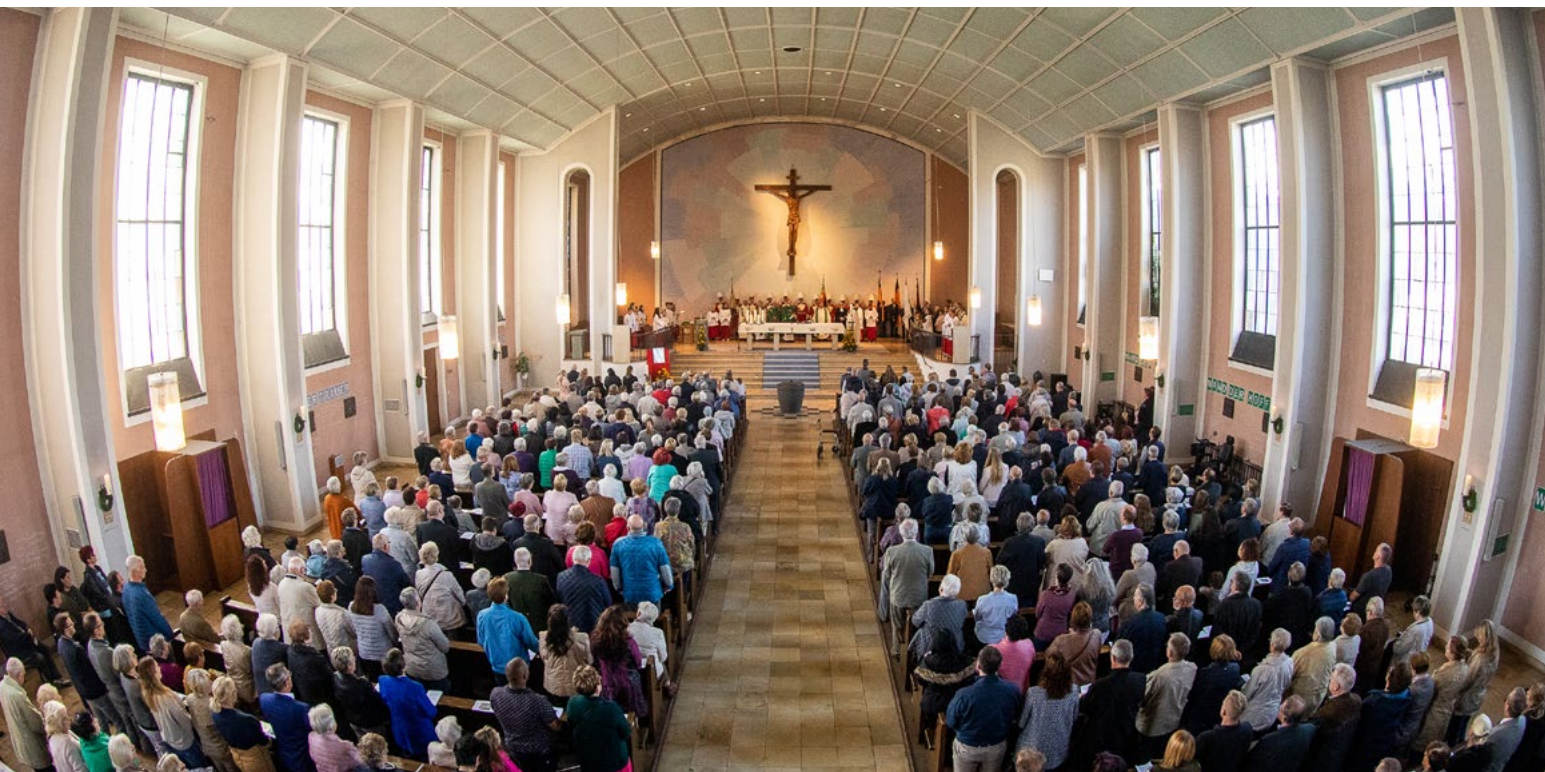
Abschied aus St. Thomas Morus

Für die Planung der Gottesdienste und weiterer Aktivitäten wurde eine ökumenisch besetzte Steuerungsgruppe gebildet, die bald für ein breites Programm im Markushaus sorgte. Jeweils am ersten und dritten Sonntag eines Monats stand ein evangelischer Gottesdienst auf dem Terminplan. Am zweiten und vierten Sonntag feierten die katholischen Christinnen und Christen Eucharistie. Wenn es einen fünften Sonntag im Monat