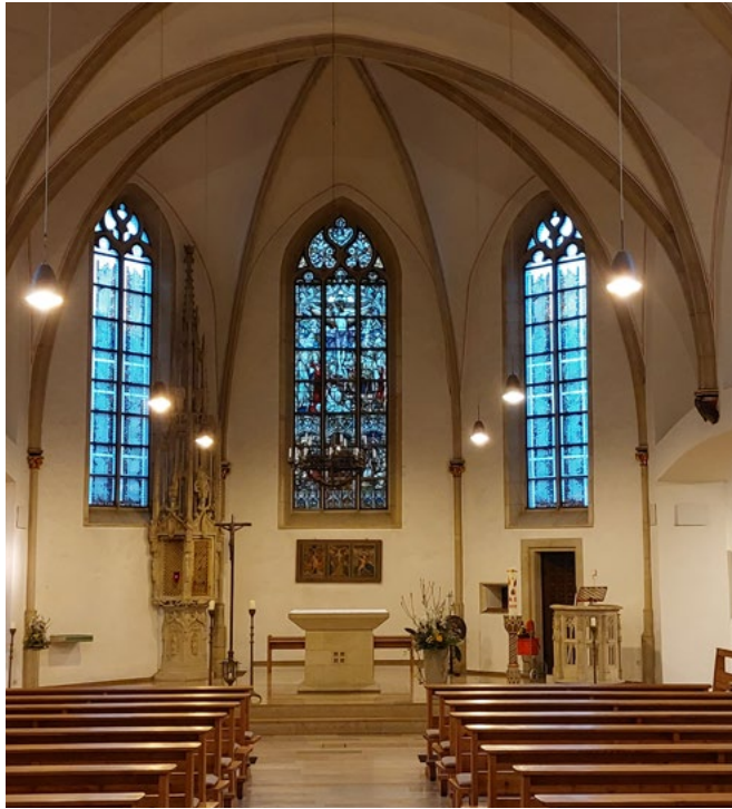
Links: Blick auf das Zentrum der St. Sebastian Kirche: Kreuz, Altar und Ambo. Rechts oben: Skulptur „Die Begegnung“ von Hubert Teschlade Rechts: Blick von der Altarinsel zum Seitenschiff mit Orgelempore