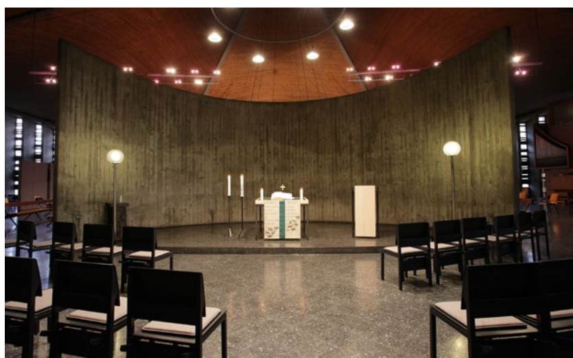
Blick auf den Nebenaltaar (kleiner Gottesdienstraum)

Im Reformationsjahr 2017 begannen die konkreten Gespräche zur vertraglichen Regelung der ökumenischen Kirchennutzung. Hierzu wurden die jeweiligen kirchenaufsichtlichen Ebenen in Aachen und Düsseldorf hinzugezogen. Durch ihre jeweiligen Fachreferate haben sie die Gespräche beratend begleitet. Als Problem stellte sich die Frage nach dem Umgang mit gottesdienstlichen Handlungen, die nach der liturgischen Ordnung des Vertragspartners ausgeschlossen sind. Diese Frage konnte durch „die Verpflichtung zu gegenseitiger Rücksicht und Wertschätzung“ und durch die wechselseitige Anerkennung der grundlegenden Bindung der beiden Gemeinden an ihre jeweiligen Agenden bzw. liturgischen Normen geregelt werden. 14 Dieser Lösungsansatz kam unter anderem