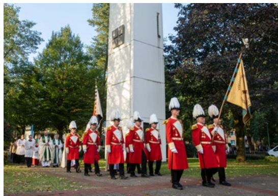
Oben: Umzug in das ökumenische Zentrum im Markushaus Links: Nach dem letzten Gottesdienst in der Kirche St. Thomas Morus versammelt sich die Gemeinde im Markushaus, das zum ökumenischen Zentrum wird.