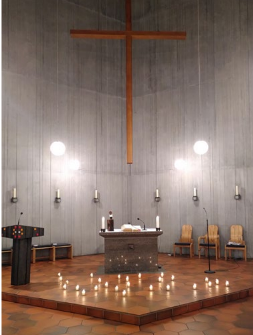
Innenraum des Ökumenischen Zentrums

wickeln, stand daher für 2019 auf der gemeinsamen Agenda. Auch für 2020 wurden entsprechende Angebote geplant, doch dann kam die Corona-Pandemie und die geplanten ökumenischen Veranstaltungen konnten nicht stattfinden.