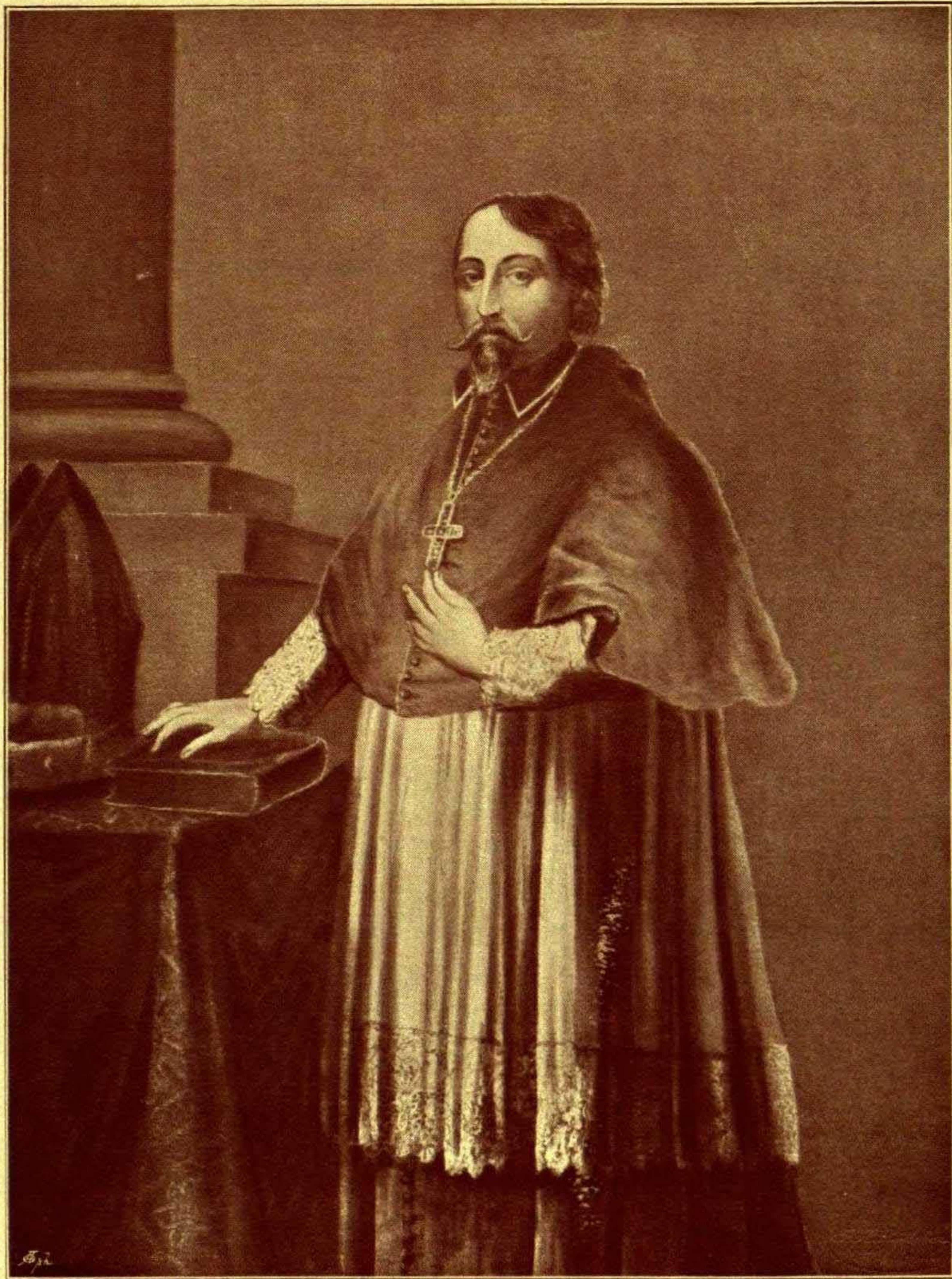
Burchard von Oberg. Bischof von Hildesheim. 1557—1573. Ölgemälde der bischöflichen Kurie.