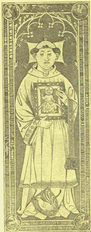
Abb. 122. Grabmal des Dompropstes Etkard (I.) von Hanenfee, † 1405.