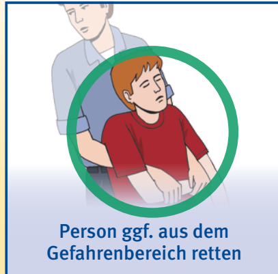
Person ggf. aus dem Gefahrenbereich retten